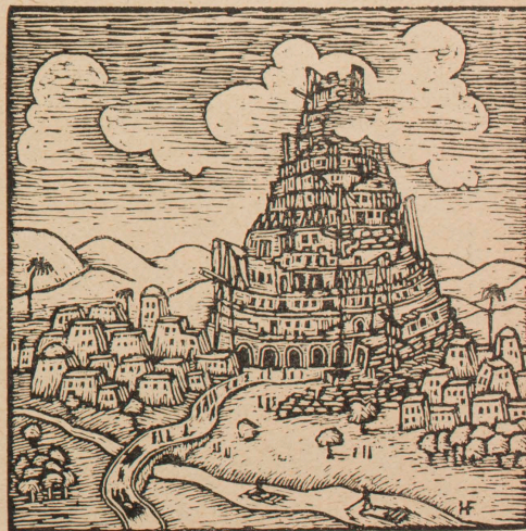
„Wohlan! Wir wollen eine Stadt bauen und einen Turm, dessen Spitze bis zum Himmel reicht“ (1. Buch Moses 11,4)

*) Die Bibel, Das erste Buch Moses. 135 Holzschnitte von Hermann Fechenbach. Am 1. und 15. jeden Monats erscheint ein neues Bild. Abonnenntenpreis: M. 1,50 pro Originalholzschnitt. Einzelpreis: M. 4.—. Bild Nr. 22 erschien am 1. Juni 1925. Es werden pro Bild nur 200 Originale abgezogen. Sämtliche Bilder von Nr. 1 an können nachbestellt werden. Bestellungen nimmt die Ewer-Buchhandlung, München, Ottostr. 2 entgegen.